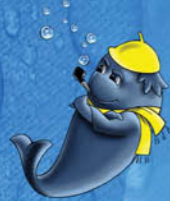
2. Žiedas Leonas Strioga, 1978